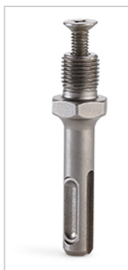
Adaptér pro sklíčidlo 1/2" (obj.č. 272.639).