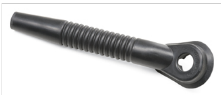
Odsávání vrtání se nasune na sací hadici FLEX nebo na různé adaptéry, tím dochází k tomu, že se prach odsává přímo u vrtané díry. Nevznikají žádné zbytky prachu. Pro vrtací práce do průměru vrtání 24 mm.